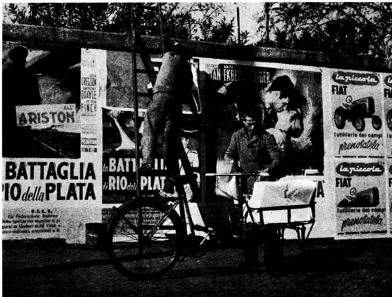
La pubblicità cinematografica in Italia è ossessionante e applicata senza criterio di gusto e di morale.

di essere o di apparire intolleranti. Invece non c'è nessun dubbio che noi come tutti gli altri abbiamo diritto alla nostra parte di tolleranza: cioè abbiamo diritto di posare pacificamente gli occhi sulla vetrina di una libreria o su giornali e riviste esposti in un'edicola della stazione, senza sentirci per questo colpiti e vilipesi. Ed è un linguaggio, quello della tolleranza, che almeno in linea di principio nessuno può aver coraggio di contro-battere.